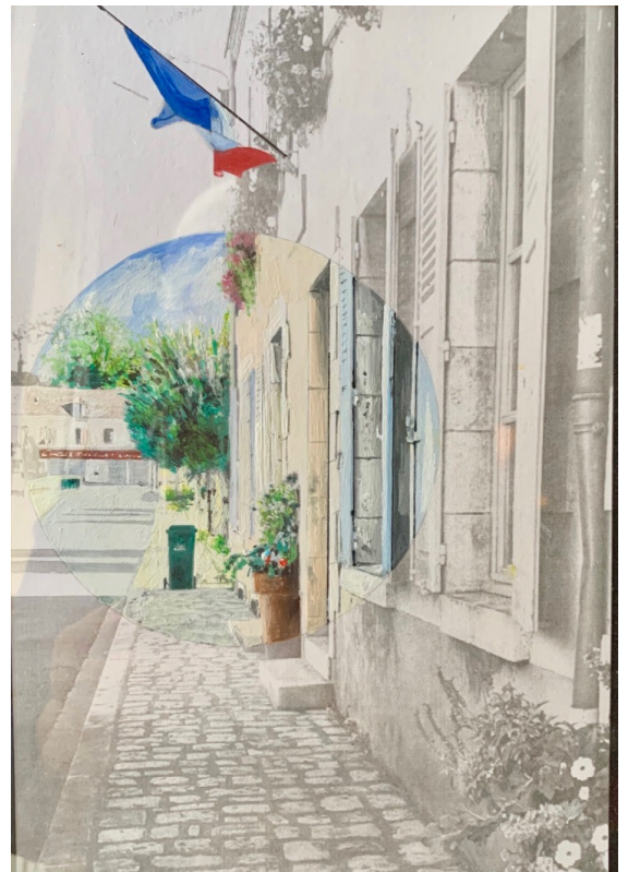
Mairie d'Ouzouer sur Trézée 1 rue Grande - 45250 Ouzouer sur Trézée Tel : 02 38 31 93 90 - Fax : 02 38 29 60 00 mairie-secretariatg@ouzouer-trezee.fr